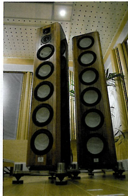
Marten Coltrane Supreme i egen högre person med bastornet innehållande sex keramiska 9-tums basar och huvudsystemet där mellanregistret täcks av ett 2-tums element i diamant!