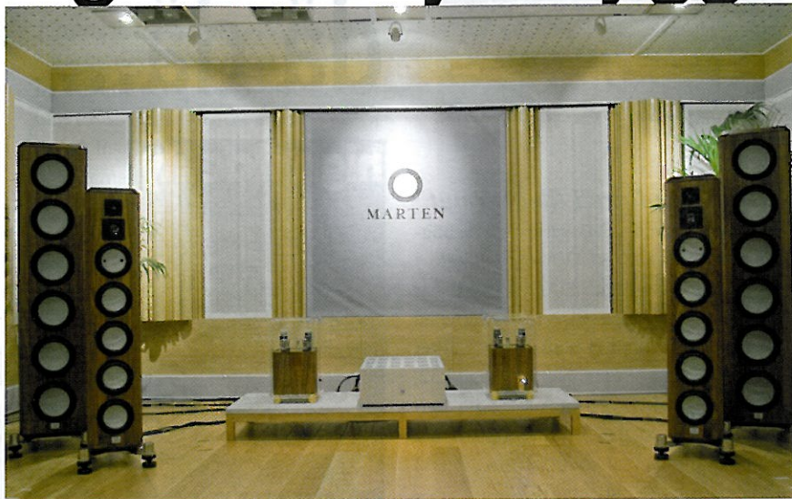
Hela frontupställningen med Coltrane Supreme och The Lars. Rummet är ett Level 3 rum designat av Svanå miljöteknik.

Coltrane Supreme och The Lars fick stor uppmärksamhet på utställningen i München. Vi fick möjlighet att höra dem på hemmaplan