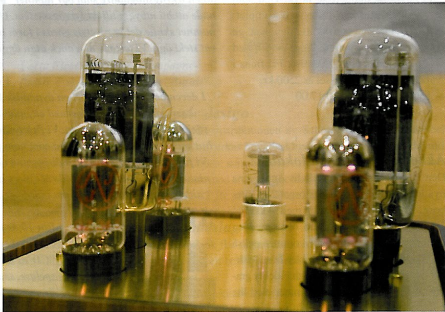
Här har vi alla The Lars rör i stram givakt. 300B som slutrör och GZ34 till likriktningen.

Anläggningen startar med en Bladelius Gondul M multispelare/försteg (90.000 kr)