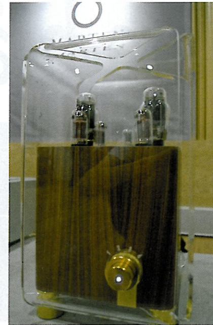
The Lars rörförstärkare som är en integrerad konstruktion baserad på 300B rör med två separata kanaler. Den vi ser på bild innehåller volym och ingångsväljaren.